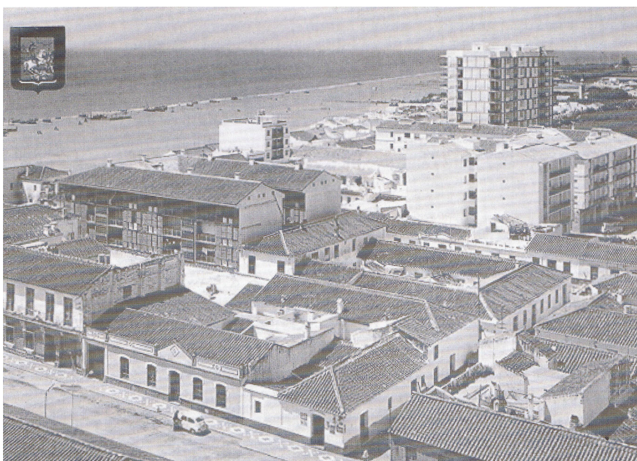
Torre del Mar en los años 60.

Inaugurados en el verano de 1929, en estas instalaciones se realizaban baños calientes o templados, y baños en el mar, al aire y al sol