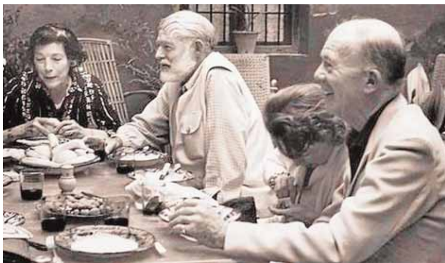
Gamel Woolsey y Gerald Brenan, con Ernest Hemingway entre ellos.

reunión en Londres con los gestores de los derechos de la novela y pedían una cifra razonable, pero entonces Banderas ya había comenzado a hablar de rodar otro proyecto, 'Boabdil', explica el cineasta, autor también de 'Por la gracia de Dios', la polémica cinta documental sobre la Semana Santa de Málaga de la que el pasado año se cumplieron cuatro décadas.