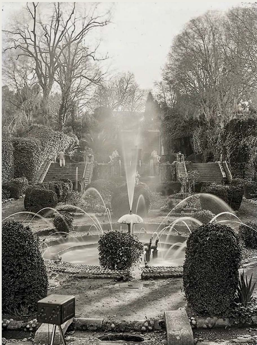
EL RETIRO, JARDÍN CORTESANO DEL SIGLO XVIII

incluye el estanque superior y la Fuente de las Batallas y Parras. El «Jardín Patio», cuyo diseño corresponde al gusto de los dos primeros condes de Buenavista (primera mitad del siglo XVIII), acoge la mayoría de las esculturas traídas de Italia, tales como la Fuente del Tritón y la Nereida, los bustos sobre pedestales de los personajes de la Comedia del Arte y la representación de personajes mitológicos en el cierre perimetral. En cuanto al «Jardín Cortesano», que diseñó el conde de Villalcázar de Sirga y realizó José Martín de Aldehuela entre 1784 y 1794 es, probablemente, donde mayores daños se han apreciado sobre las piezas escultóricas y secundarias.