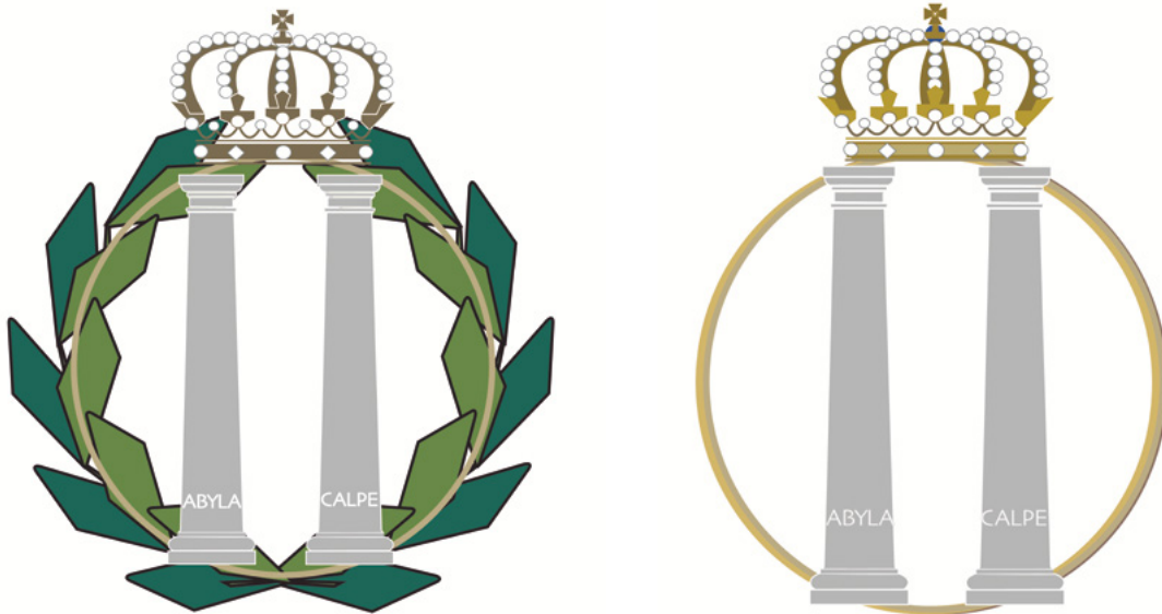
IZQUIERDA: MEDALLA E INSIGNIA DE ANDALUCÍA PARA LOS PARLAMENTARIOS. DERECHA: MEDALLA E INSIGNIA DE ANDALUCÍA PARA LOS DISTINGUIDOS CON ESTE GALARDÓN POR PROVINCIAS

identidad visual de servicio corporativo, paralela al escudo oficial, que al menos posee inicialmente un atractivo y alude a algo tan unánime como es el nombre de Andalucía. Sin embargo, es un anagrama del que existen innumerables versiones similares, referidas a otras entidades, e incluso una delicada coincidencia con diseños registrados por una empresa cuya finalidad es ingresar beneficios por los derechos de uso de sus propuestas. Pero esta nueva identidad visual corporativa del Gobierno de Andalucía no resuelve aún poder disponer de un escudo o emblema adecuado que represente a su territorio y, a su vez, al organismo responsable de su administración.