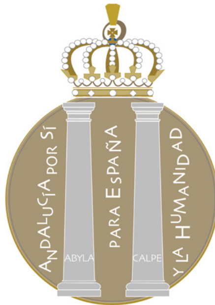
MEDALLA E INSIGNIA PARA HIJO PREDILECTO DE ANDALUCÍA, CON TIPOGRAFÍA PERFORADA EN LA CHAPA DEL SOPORTE