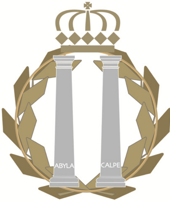
MEDALLA E INSIGNIA DE ORO DE ANDALUCÍA V.1