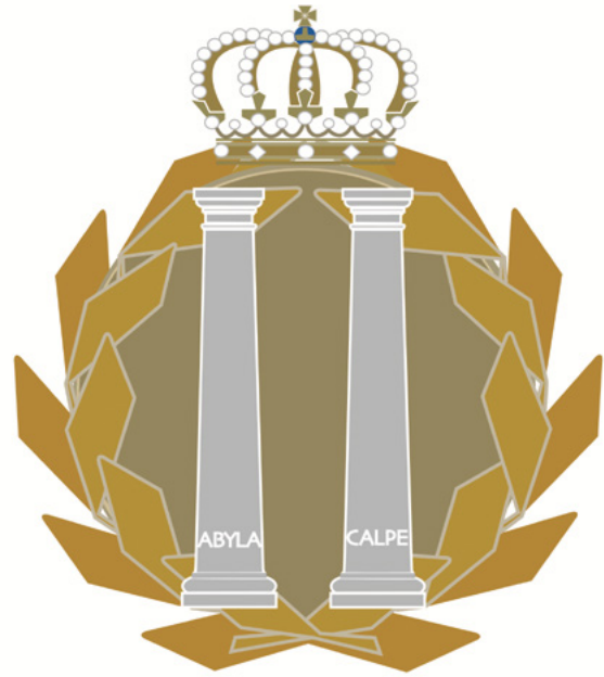
MEDALLA E INSIGNIA DE ORO DE ANDALUCÍA V.2